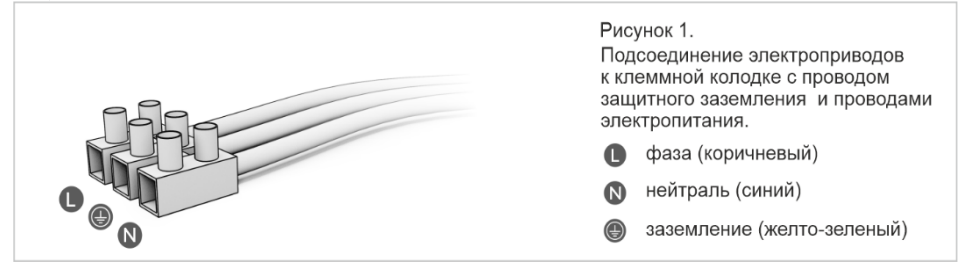
Рисунок 1. Подсоединение электропроводов к клеммной колодке с проводом защитного заземления и проводами электропитания.