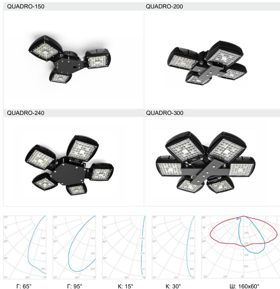
Таблица 3. Возможные неисправности и способы их устранения